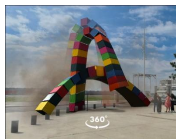
3 – Une expérience immersive à 360° se superpose au paysage réel, l'environnement s'anime.