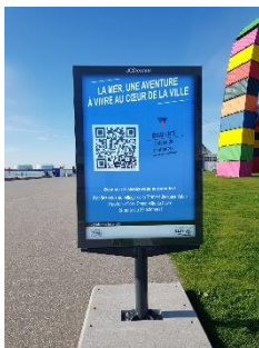
1 – Un QR code est affiché sur le MUPI JCDecaux pour démarrer l'expérience de réalité augmentée.

Ce parcours sensoriel et immersif est une invitation à partager, avec le plus grand nombre, l'héritage maritime de la ville et à faire vivre l'esprit nautique.