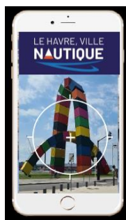
2 – Avec son smartphone, le visiteur vise un élément du paysage.