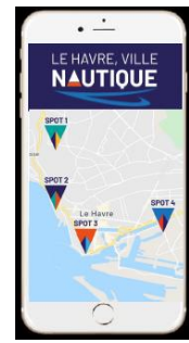
4 – A la fin de l'expérience, le public est invité à se rendre au prochain spot ou à partager un teaser sur les réseaux sociaux.

Cette expérience de réalité augmentée, gratuite pour les habitants et visiteurs du Havre, fait partie des expérimentations innovantes prévues dans le cadre du contrat de mobilier urbain de la ville du Havre, remporté par JCDecaux en 2020 (abris-voyageurs, Mobiliers Urbains pour l'Information, écrans numériques tactiles ...).