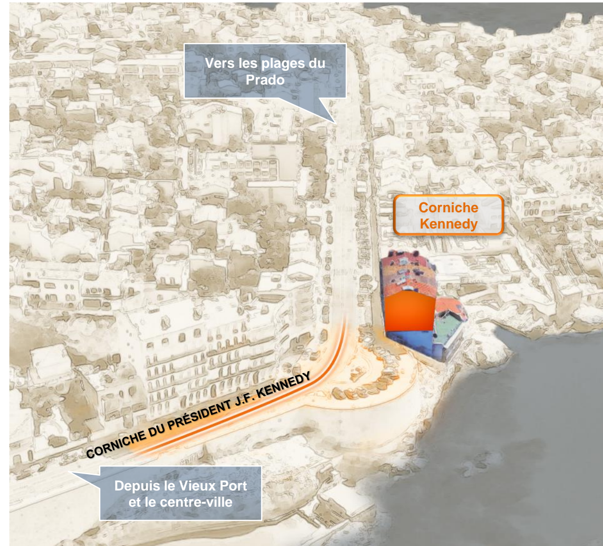
→ Axe de visibilité