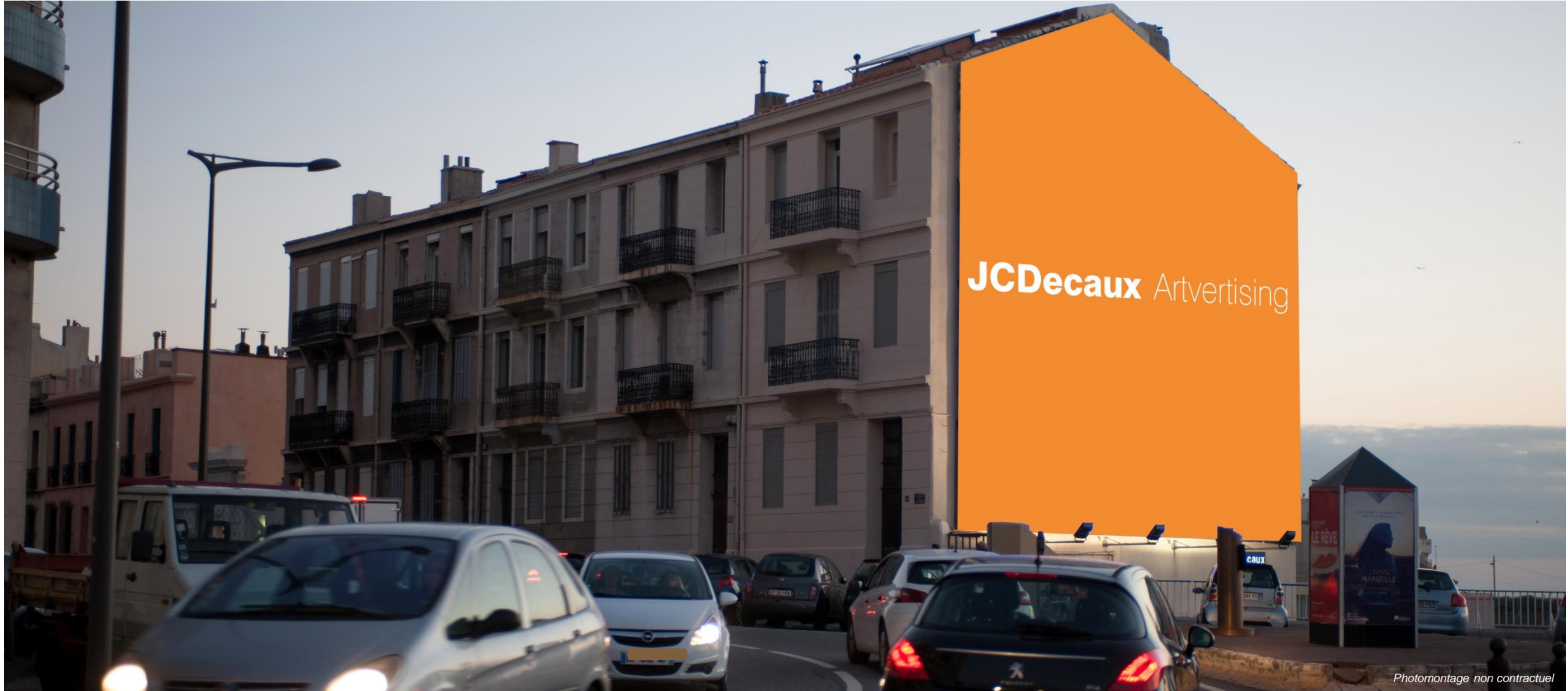
Photomontage non contractuel